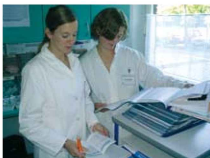
Abb. 3. Auf Station beschäftigen sich die Studierenden intensiv mit der Patientendokumentation

tet wird, da die Pharmakotherapie als wichtige Schnittstelle zwischen beiden Examensfächern angesehen wird.