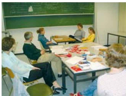
Abb. 2. In Rollenspielen werden die Studierenden des Wahlpflichtfachs Pharmazeutische Betreuung auf den Betreuungsprozess und die Kommunikation mit dem Patienten vorbereitet