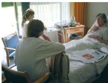
Abb. 4. Zwei Studierende sprechen mit einer Patientin über ihre Medikation